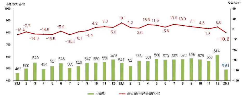
< 월별 수출액 및 증감률 >